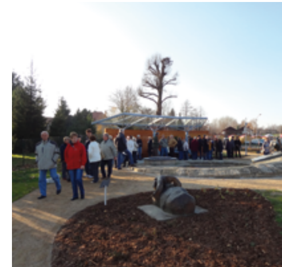
Reger Andrang am Eröffnungstag

Boden im Park wegen der gerade erst abgeschlossenen Bauarbeiten nicht vollständig verdichtet. In diesem Zustand wäre er im Winterhalbjahr besonders anfällig für Schäden.