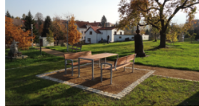
Viele Sitzgelegenheiten laden zum Verweilen ein