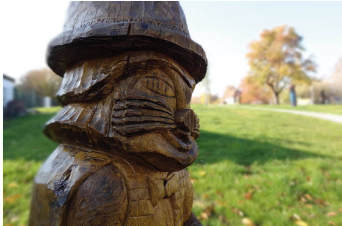
Am Zugang Ernst-May-Straße begrüßt der gestiefelte Kater die Besucher