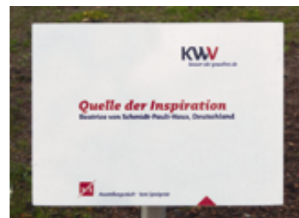
Schilder an den Wegen erläutern die Skulpturen und informieren über die Künstler

Flächen zum Aufstellen von Marktständen entlang der Wege platziert. Gleichzeitig wurden notwendige Versorgungsleitungen für Strom und Wasser verlegt.